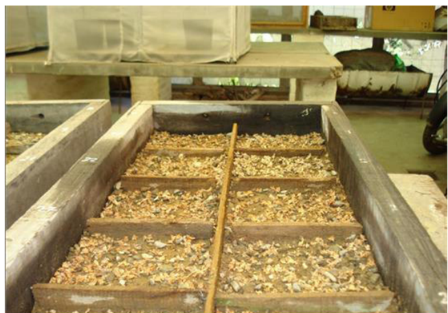
Figura 3. Siembra de semillas de P. tomentella en invernáculo

En los viveros, se realizaron 12 siembras por mes a lo largo del año. Como germinadores se utilizaron cajones de madera de 58x30x12 cm (Fig. 3), y como sustrato tierra de hasta 30 cm de profundidad de Quebraleña. Para cada siembra, se midió la germinación, de manera mensual registrando todos los nacimientos de plántulas hasta que ya no se produjeran más, considerando el nacimiento como la extensión completa de los cotiledones. Se regó hasta la capacidad de campo cada 2 o 3 días.