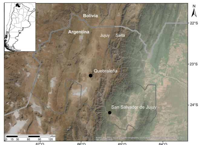
Figura 1. Localización de la provincia de Jujuy en la Argentina (recuadro) y los sitios de estudio (Quebraleña y San Salvador de Jujuy) dentro de la provincia de Jujuy sobre una imagen satelital de espectro visible, tomado de Esri.

En el presente trabajo se recolectaron semillas y trozos de ramas jóvenes de los árboles de P. tomentella en la localidad de Quebraleña (Cochinoca, Jujuy, Argentina). Se realizaron los ensayos en el invernáculo de la escuela rural N° 381 de Quebraleña y el de la Facultad de Ciencias Agrarias, Universidad Nacional de Jujuy, San Salvador de Jujuy en la provincia de Jujuy (Fig. 1).