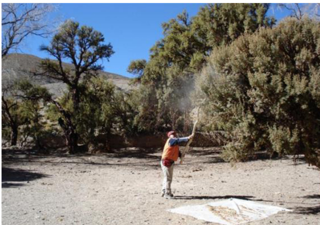
Figura 2. Foto de la técnica de recolección de semillas de P. tomentella en la localidad de Quebraleña, Jujuy, Argentina.

Todas las semillas y ramas utilizadas en los ensayos provenían del bosque de Quebraleña. Se eligieron 10 árboles a más de 50 metros entre sí, con las siguientes características: 1. Se evitaron ejemplares aislados; se estimó la cobertura del bosque en un radio de 25 m alrededor del árbol y se eligieron lugares con una cobertura del 10% mínimo. 2. Altura del individuo: 3 o más metros, estimando a ojo la altura desde su base hasta la rama más distante. La recolección de semillas se realizó mensualmente. Con la ayuda un bastón de 3 m de largo se sacudieron las ramas sin dañar en lo posible el follaje para desprender las semillas y recolectándolas en un plástico de 3 x 2 m colocado en el suelo (Fig. 2). Cada vez se colectó una cantidad que aseguraba los ensayos del mes (mínimo de 4.000 por mes). Una vez recolectadas las semillas, éstas se guardaron en bolsas de polietileno, rotuladas, marcando número de árbol y fecha de la colecta.